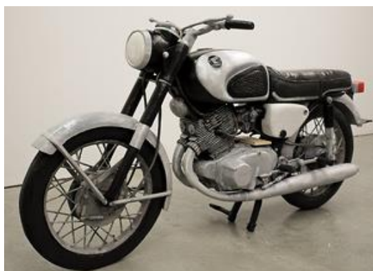
Conrad BAKKER « Honda CB77 Superhawk », 2014, huile sur bois sculpté

Visite galerie Musidora pour les enseignants, conférence dans l'amphithéâtre, et vernissage le jeudi 10 novembre . Exposition visible jusqu'au lundi 12 décembre