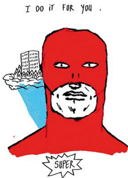
Christophe Blanc, « Je suis Super », 2016, Projet Transmédia

Exposition visible du vendredi 13 janvier jusqu'au dimanche 19 février .